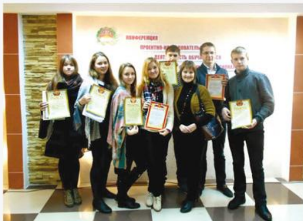
Делегация студентов КИТП на научно-практической конференции, г. Гороховец Владимирской области. Первое и 4 призовых места. Осень 2014 г.

Очная контрактная форма обучения на базе 9 классов